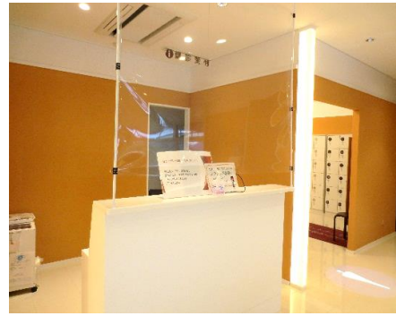
( 2階 )