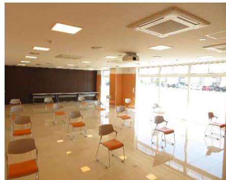
1階セミナー室(待合室)