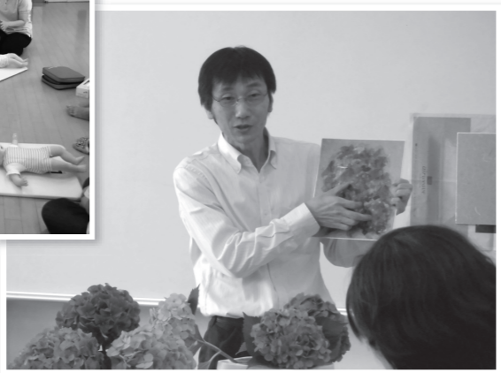
地域公開講座(臨床美術講座)

また、全教職員を対象としたストレスチェックを1年に1度、1ヶ月の残業時間が30時間を超えた教職員を対象とした健康状態チェックを即時に行うなど、教職員の健康状態に配慮しています。