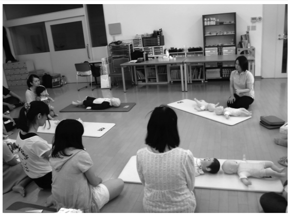
地域公開講座(子育て講座)

公開講座の実施や地域連携の推進を行う、地域の方々との交流窓口です。地域のための福短、「地(知)の拠点」として地域のニーズに応えます。公開講座は、子育てや高齢者支援心理学、臨床美術等の分野で、年間を通して実施しています。